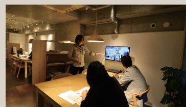
建築家とつくる暮らしの奥まで考える提案