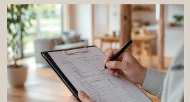
定期点検や暮らしの相談を通して、長く安心して暮らせるサポート